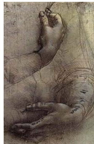
Leonardo da Vinci estudo de braços e mãos (c. 1474)