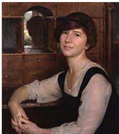
Dame Freya Madeline Stark

Estará patente ao público, durante o mês de Junho, uma exposição de obras de referência na área da literatura de viagens na biblioteca do Centro de Estudos Humanísticos.